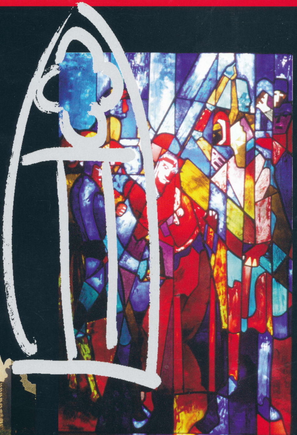
Glasfenster In der Johannes-Kirche, Brünninghausen